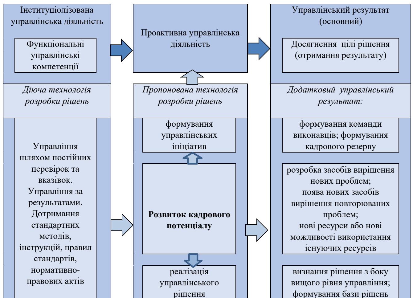
Рисунок 3.1 – Кадровий потенціал як основа ефективних технологій розробки управлінських рішень в Хмельницькій обласній раді

Щоб просування ініціативи і інтеграція прихильників виявилися можливими, суб'єкт управлінської діяльності повинен сформувати власну управлінську комунікативну мережу з використанням ресурсу організаційної комунікативної мережі і організаційної управлінської мережі (організаційної ієрархії). Таку комунікативну структуру, вибудовану цілеспрямовано для вирішення конкретного управлінського завдання, можна назвати індивідуальною управлінською мережею [61]. Саме для вирішення подібних завдань потрібно розвивати кадровий потенціал (рис.3.1).