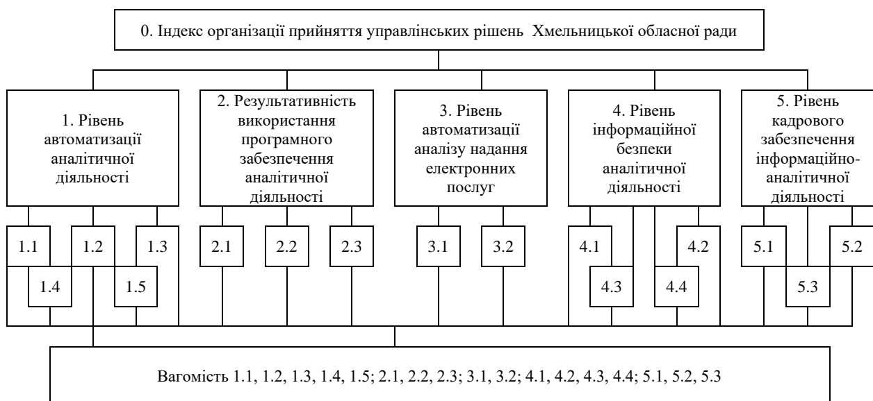
Рисунок 2.2 – Модель ієрархії визначення вагомості складових індексу організації прийняття управлінських рішень органу публічної влади Примітка. Складено автором

Таким чином, маємо просту ієрархію, наведену на рис. 2.4.