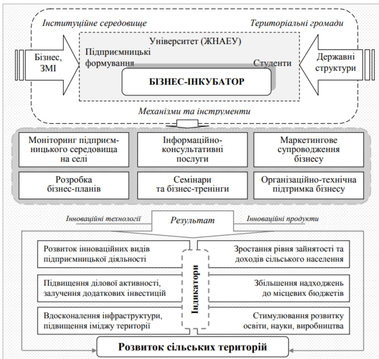
Рис. 3.1. Вплив бізнес-інкубатора на розвиток сільських територій Джерело: [55].

господарську діяльність науково-інноваційних методів та технологій, підвищення конкурентоспроможності, скоротити виробництво, матеріально-технічне забезпечення та транзакційних витрат, що посилюють соціальну відповідальність (рис. 3.1).