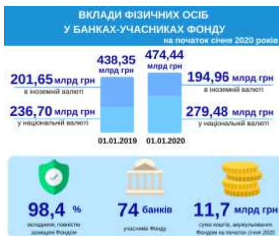
Рисунок 2.2 - Вклади фізичних осіб у банках-учасниках фонду гарантування вкладів

Повністю захищені вклади (у розмірі від 10 грн до 200 000 грн) 98,4% вкладників у банках-учасниках Фонду. Також за сумою гарантіями Фонду повністю покривається 43,1% вкладів, що складає 204,24 млрд грн. В структурі вкладників частка ФОП становить 3,0%, а загальна сума їх вкладів на 1 січня 2020 року склала 32,40 млрд грн (6,8% від загальної суми вкладів). Нагадаємо, з 1 січня 2017 року під гарантії ФГВФО підпадають вклади фізичних осіб-підприємців. Станом на 1 січня 2020 року у реєстрі учасників Фонду гарантування нараховувалося 74 банка. Загальна сума коштів, акумульованих Фондом на початок січня 2020 року, склала 11,7 млрд грн [40].