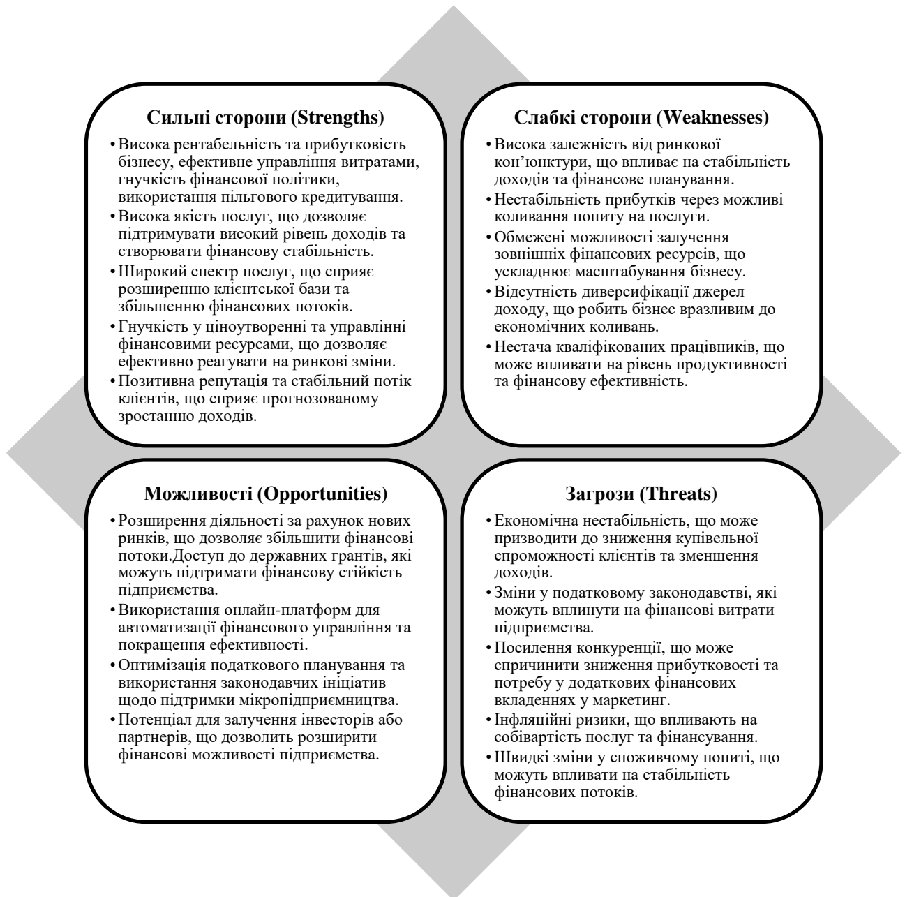
Рисунок 2.3 – SWOT-аналіз управління фінансами «ФОП Поворознюк»*

ефективність. Основні загрози пов'язані з економічною нестабільністю, податковими змінами та конкуренцією, що потребує стратегічного підходу до управління фінансами.