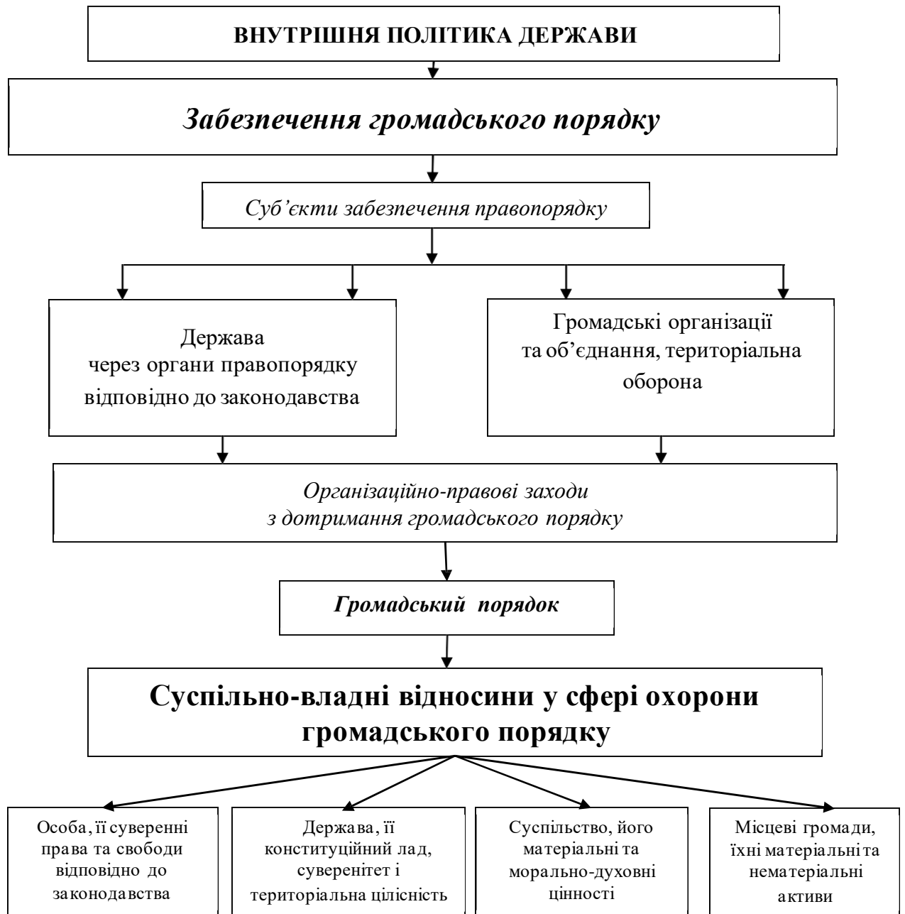
Рис. 2.2. Схема суспільно-владної взаємодії у забезпеченні громадського порядку в контексті національної безпеки України.

потенціалом, він є носієм широкого спектра здібностей, що дозволяють здійснювати безпосередню діяльність з різними групами населення, з органами державної та місцевої влади, у тому числі й в умовах триваючої військової агресії на території України.