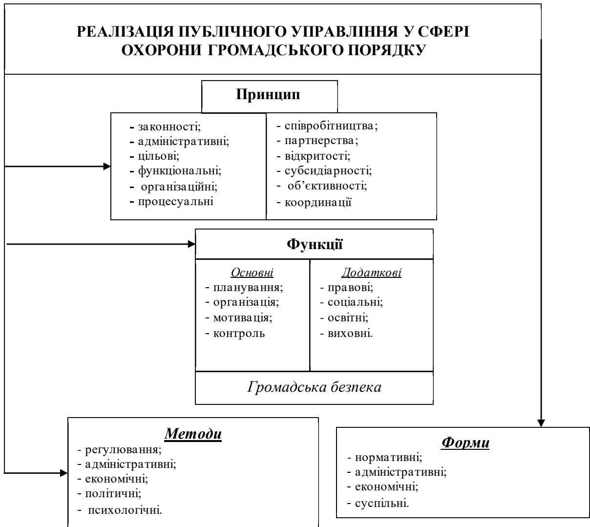
Рис. 2.1. Структурно-організаційна схема у сфері публічного управління охороною громадського порядку України.