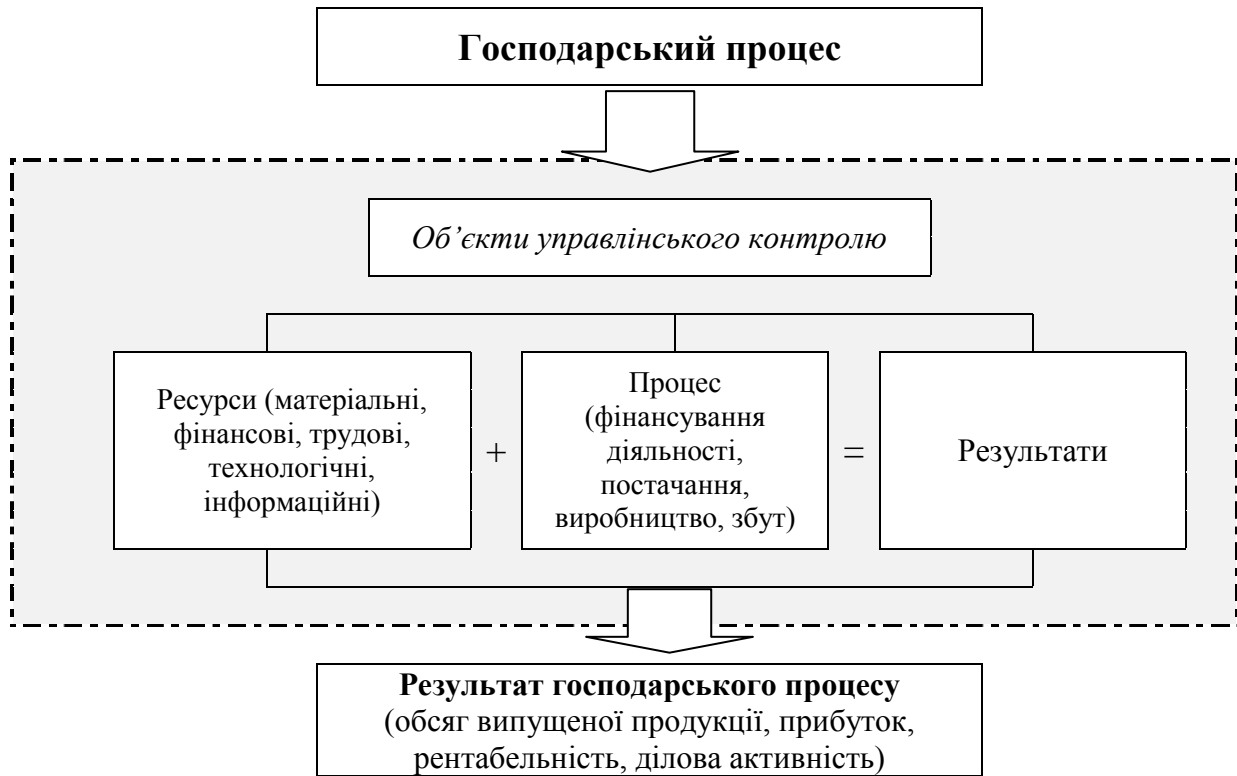
Рисунок 1.3 – Систематизація об'єктів управлінського контролю

Буває й так, що прийняті управлінські рішення є помилковими. Тому й управлінські рішення підлягають перевірці внутрішнім контролером з метою визначення їх законності та правомірності. Систематизація об'єктів управлінського контролю визначена на рис. 1.3.