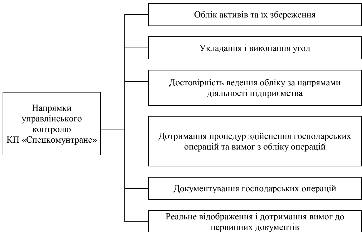
Рисунок 2.1 – Основні напрями управлінського контролю КП «Спецкомунтранс»

Основні напрями управлінського контролю у КП «Спецкомунтранс» наведені на рис. 2.1.