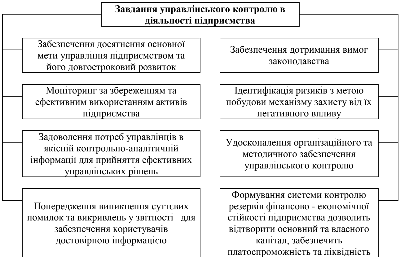
Рисунок 1.1 – Систематизація завдань управлінського контролю в діяльності підприємства

Примітка. Систематизовано автором за [1; 40]