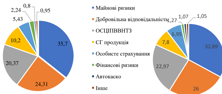
Рисунок 2.5 – Порівняльна структура страхового портфелю у 2019 та 2023 рр.

У 2023 році серед добровільних видів страхування найбільш рентабельними були страхування від нещасних випадків, пожежних та стихійних ризиків, а також страхування вантажів і багажу. Динаміка рентабельності більшості добровільних видів страхування демонструє позитивну тенденцію до зростання. Проте, управління страховим портфелем має недоліки, зокрема зниження рентабельності в окремих сегментах, таких як страхування вантажів та кредитів. Порівняння структури страхового портфеля за 2019 та 2023 роки свідчить про відносну стабільність політики компанії в цьому напрямку. Рейтингове агентство IBI-Rating підтвердило довгостроковий кредитний рейтинг УПСК на рівні uaAA з прогнозом «у розвитку». Це обумовлено стабільними позиціями компанії на страховому ринку України, прийнятною диверсифікацією страхового портфеля та високою якістю активів, якими представлені страхові резерви. Водночас агентство зазначає чутливість фінансової системи України до ризиків, пов'язаних із тривалими військовими діями та економічною невизначеністю.