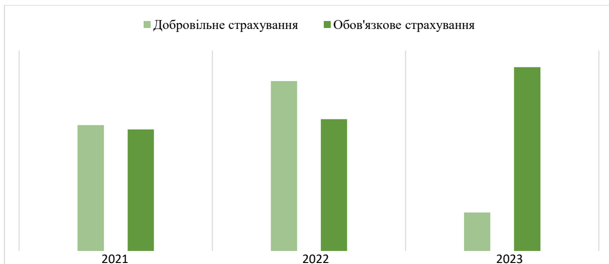
Рисунок 2.3 – Структура виплат за видами страхування у 2021-2023 рр.

Примітка: сформовано автором на основі звітності СК «УПСК»