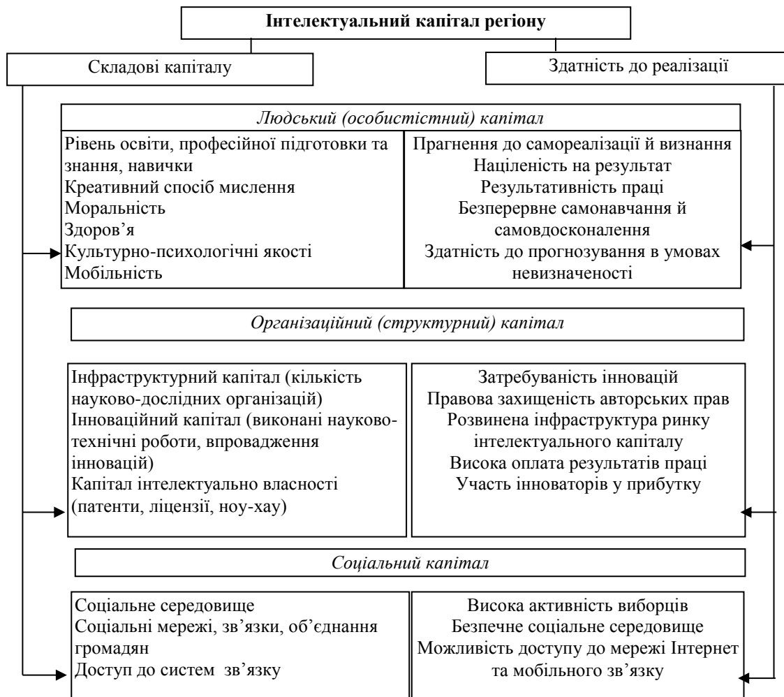
Рис. 4. Структура інтелектуального капіталу регіону