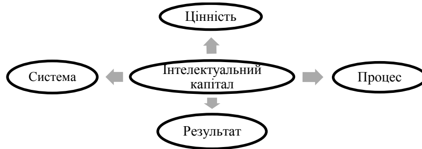
Рис. 1. Економічні аспекти дослідження інтелектуального капіталу

Вважаємо за доцільне звернути увагу на основних економічних аспектах інтелектуального капіталу (рис.1.). Так, інтелектуальний капітал виступає системою, що складається з сукупності взаємопов'язаних елементів. Також він є цінністю – активом, що приносить дохід. Крім цього, інтелектуальний капітал розглядається як процес відтворювальних характеристик, пов'язаних з кругообігом, та результат, тобто приріст у процесі споживання і наслідок процесу кругообігу.