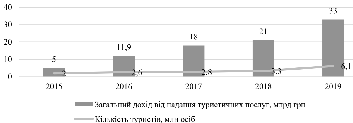
Рис. 4. Доходи туристичної галузі та чисельність туристів у 2015–2019 рр.