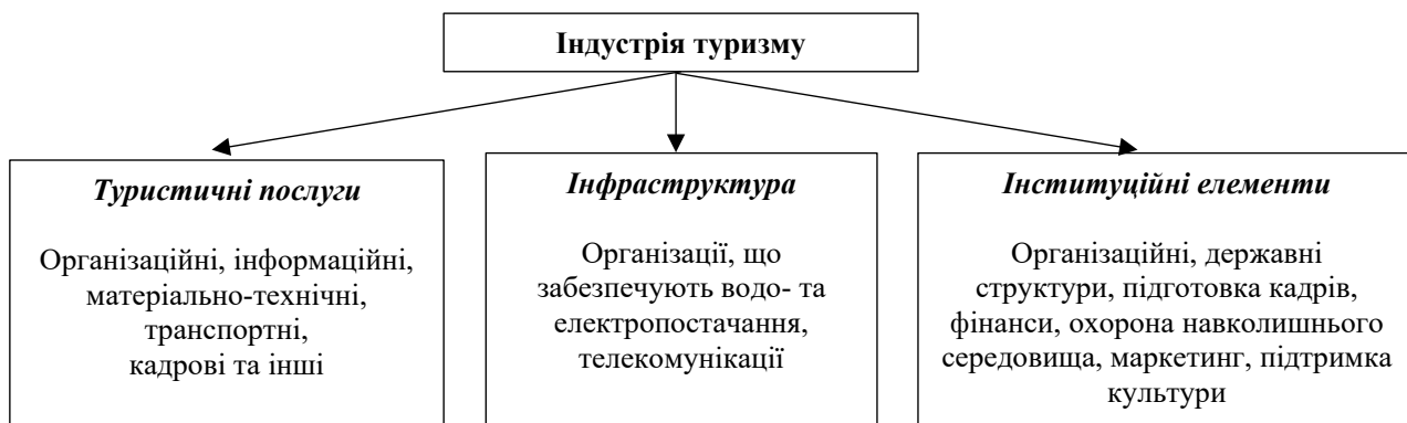
Рис. 1. Складові індустрії туризму

Джерело: побудовано авторами за даними [6, с. 45]