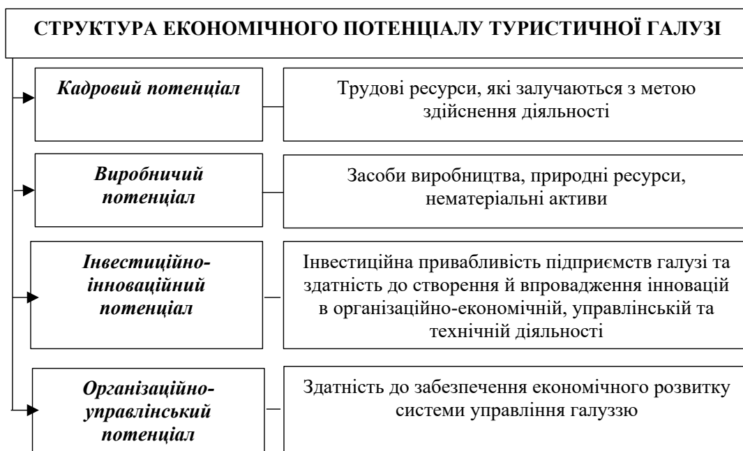
Рис. 2. Структура економічного потенціалу туристичної галузі

В 2020 році в Україні в зв'язку з пандемією COVID-19, відбулося значне падіння прибутків туристичної галузі на рівні 60–80% порівняно з 2019 роком. Загальні туристичні потоки в 2020–2021 рр. демонструють значну негативну тенденцію, але найбільшого збитку зазнали мережі готелів, музеї та сана-