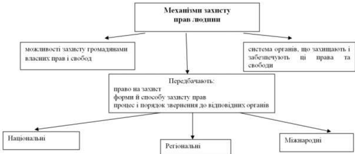
Рисунок 2.1. - Види конституційних прав та свобод людини і громадянина Джерело [106]

свободи. Інститут охорони прав і свобод означає забезпечення їх нормальної реалізації, недопущення порушень тощо. При цьому, як ми наголошували правові гарантії розповсюджуються і на випадки охорони так і на випадки захисту порушених прав.