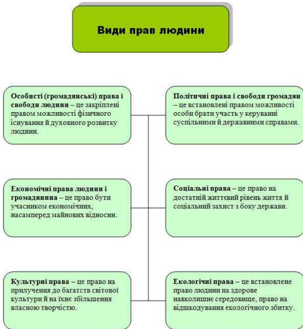
Рисунок 1.1. - Види конституційних прав та свобод людини і громадянина

Виникає закономірне питання, а чим саме є права і свободи людини і громадянина у контексті сформованих у конституційному праві гарантій. Беззаперечним є факт, що у системі правових відносин пов'язаних з гарантіями такі права та свободи є об'єктом таких правовідносин ( тобто об'єктом гарантування можливостей здійснення та захисту ).