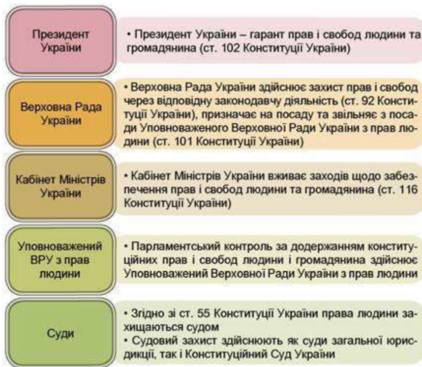
Рисунок 2.1. - Види конституційних прав та свобод людини і громадянина Джерело [105]