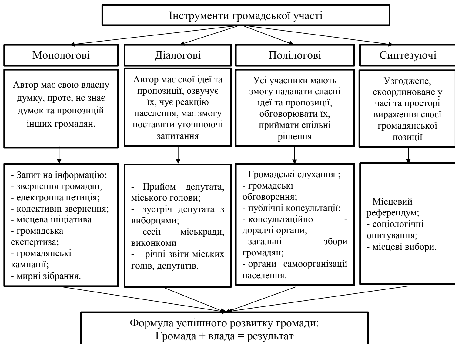
Рис. 2. Інструменти громадської участі

Окрім запропонованих моделей, для кращого розуміння, варто звернути увагу на систему інструментів громадської участі, які можуть використовуватися всередині громад (рис. 2).