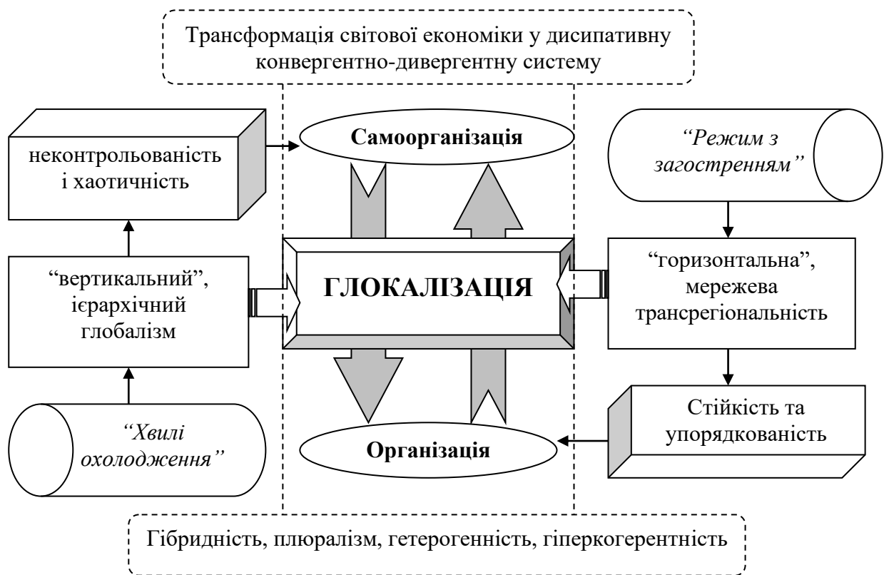
Рис. 1. Глокалізація як симбіоз ознак глобального й локального у світовій економіці як дисипативній конвергентно-дивергентній системі

процесу глокалізації виступають, перш за все, динамізм і швидкість трансформації світового валового продукту у частині підвищення частки послуг, поширення віртуальної торгівлі [8, с. 44].