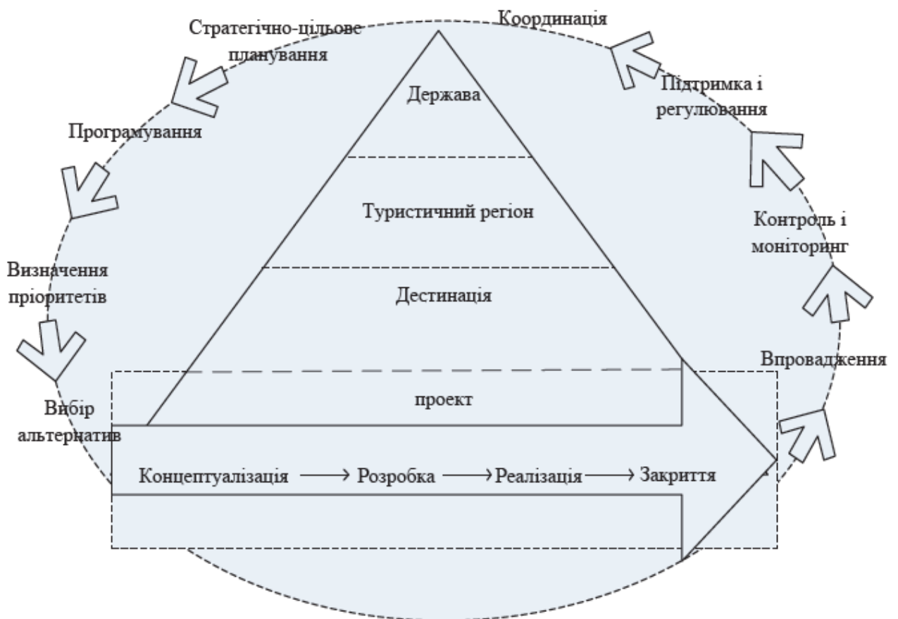
Рис.3.1 – Проектний підхід до реалізації пріоритетів державної політики розвитку туризму

Стратегічна спрямованість планування туризму потребує його регулювання на державному та регіональному рівнях шляхом прийняття цільових програм розвитку туристичної галузі, що забезпечить підвищення соціально-економічної ефективності туризму та підвищення туристичної привабливості України у світі туристичний ринок. Слід зазначити, що розвиток туризму на макроекономічному рівні, заснований на виявленні його закономірностей, тенденцій, соціальних і науково-технічних процесів, потребує координації всіх сфер економіки, пов'язаних з туризмом. Таке поєднання забезпечить інтеграцію зусиль держави та бізнесу для створення відмінної туристичної інфраструктури на основі проектного підходу (рис. 3.1).