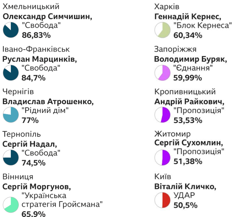
Рисунок 3.1. Рейтинг міських голів обласних центрів за результатами виборів 2020 році

Розглянемо рейтинг найпопулярніших міських голів в Україні, дані відображені на рисунку 3.1.