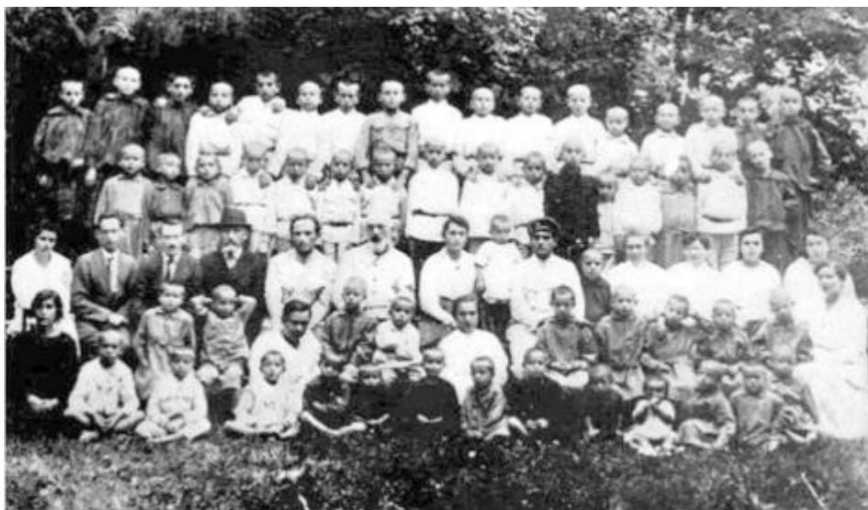
Рис. 1 . Дитячий будинок №3.