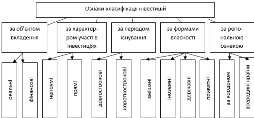
Рис. 2. Ознаки класифікацій інвестицій [3]

У результаті дослідження встановлено, що інвестиції є багатоаспектною економічною категорією, погляди на яку трансформуються з часом і залежно від тенденцій економічних знань та обумовлені специфікою конкретних етапів історико-економічного розвитку. Аналіз праць відомих науковців показав, що під час визначення економічної сутності поняття «інвестиції» здебільшого вчені ототожнюють його з категорією «капітальні вкладення», яке є більш вузьким поняттям і може розглядатися лише як одна із форм інвестицій. Установлено, що законодавство України обумовлює існування різних тлумачень поняття «інвестиції», що спричиняє значні розбіжності в установленні цілей, інструментів та досягненні кінцевої мети інвестування. Існуючі в сучасній літературі неточності в