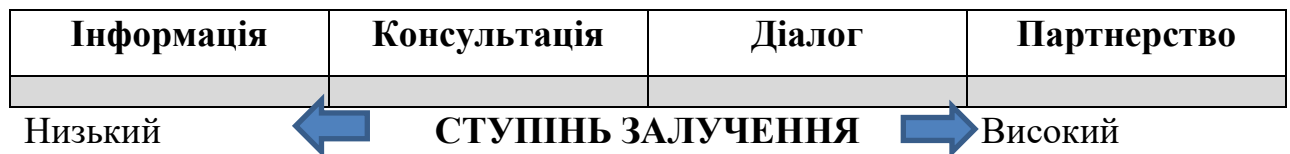
Рис. 1.1 Ступені залучення громадськості

Взаємодія передбачає різну ступінь участі громадськості (див. рис 1.1).