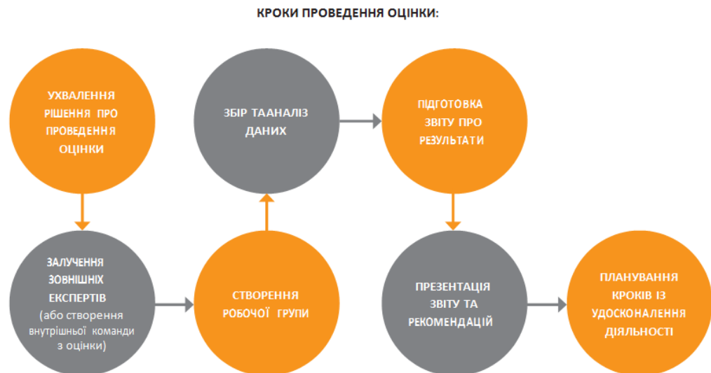
Рис. 3.1 Кроки проведення оцінки

Важливість підтримки даних та вимірювань. Оцінку дуже важко провести без отримання достовірної інформації про результати взаємодії міністерства (інших ЦОВВ) з громадськістю. Для забезпечення цієї надійності враховуються офіційні дані з відкритих джерел інформації.