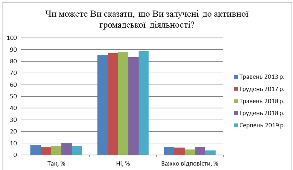
Рис. 2.3. Опитування щодо залучення громадян до активної громадської діяльності.

Незмінним залишається низький рівень власної долученості громадян до громадської діяльності (рис.. 2.3).