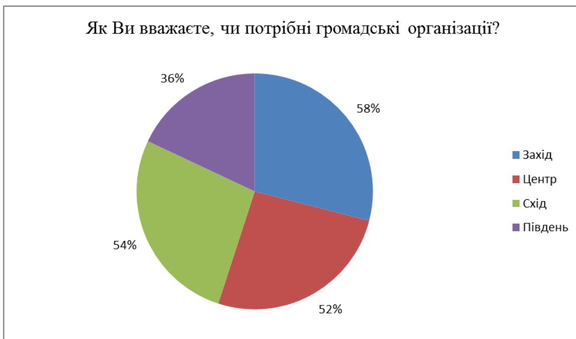
Рис. 2.1. Опитування по регіонах, про необхідність громадських організацій.

Дані по регіонах на дане питання розділились так рис.2.2.