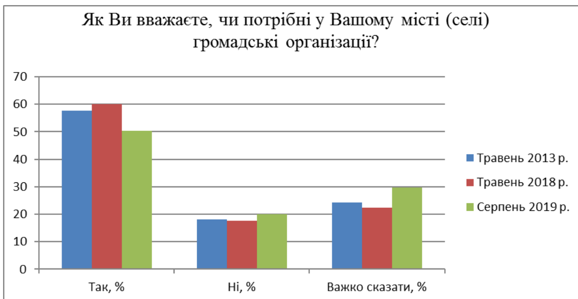
Рис. 2.1. Опитування чи потрібні громадські організації за 2013,2018,2019 роки Примітка. Складено автором на основі даних []

Дані по регіонах на дане питання розділились так рис.2.2.