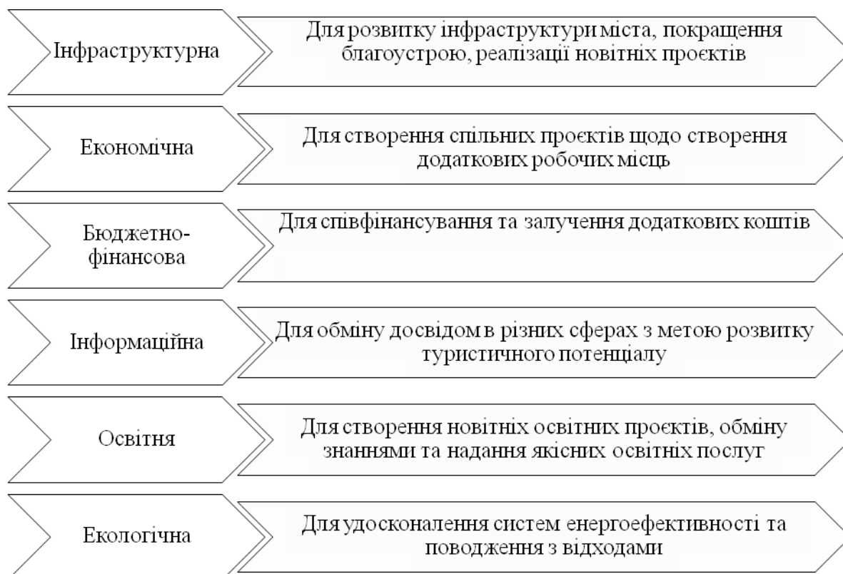
Рисунок 3.3 Основні сфери співпраці Хмельницького та міст-побратимів