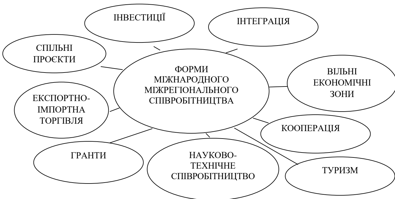
Рисунок 1.2. Форми міжнародного міжрегіонального співробітництва

Для налагодження і реалізації ефективної співпраці між регіонами різних країн використовуються різні форми міжнародного міжрегіонального співробітництва, що є основою для визначення напрямку співробітництва (рисунок 1.2).