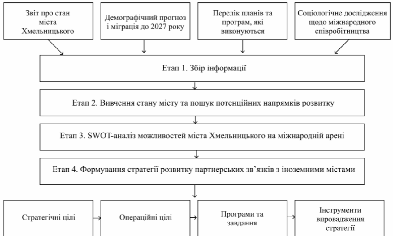
Рисунок 3.2 Етапи формування стратегії налагодження та розвитку побратимських зв'язків м. Хмельницького