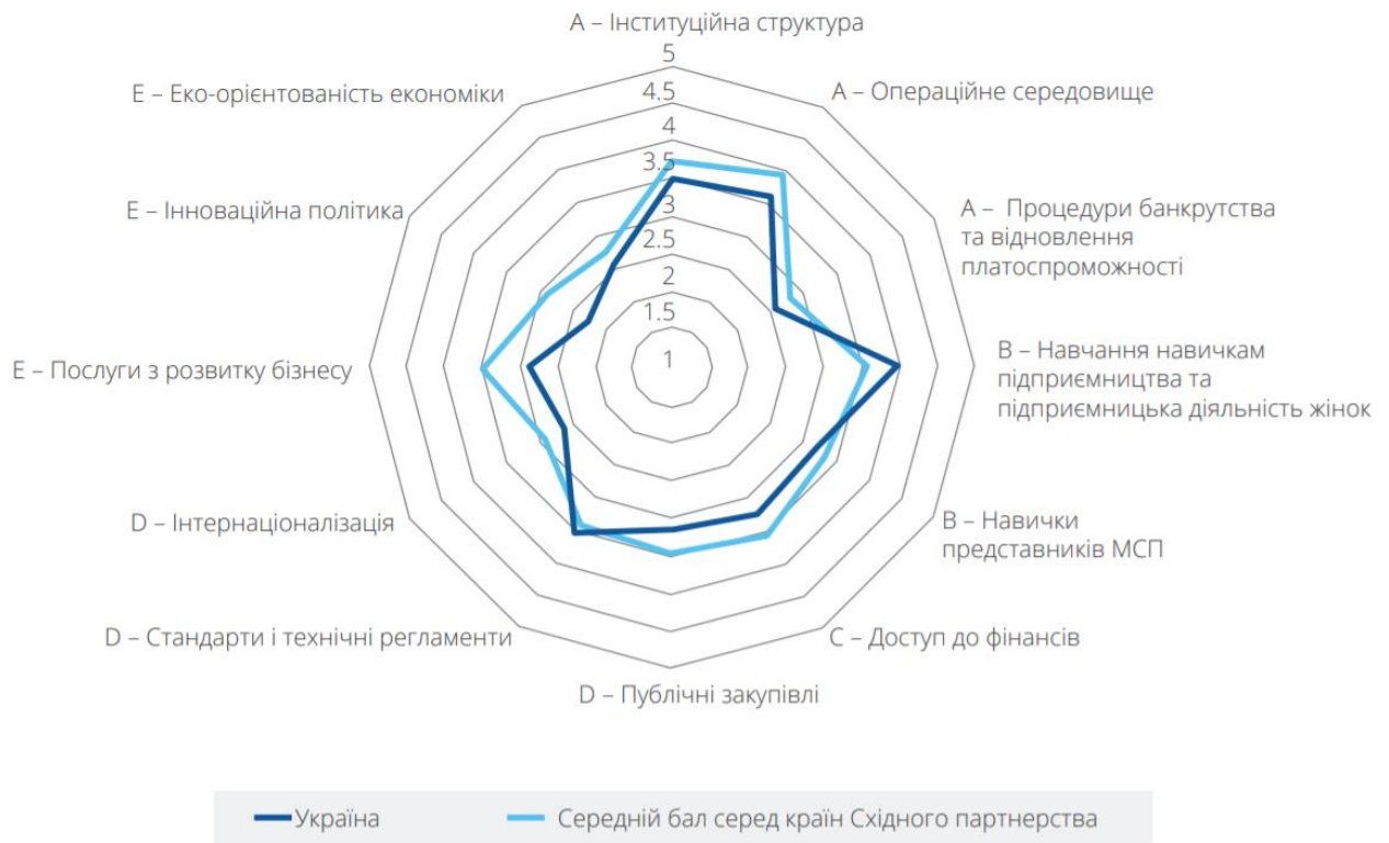
Рис.2.1 – Показники Індексу політики малого та середнього підприємництва в Україні у 2020 р.