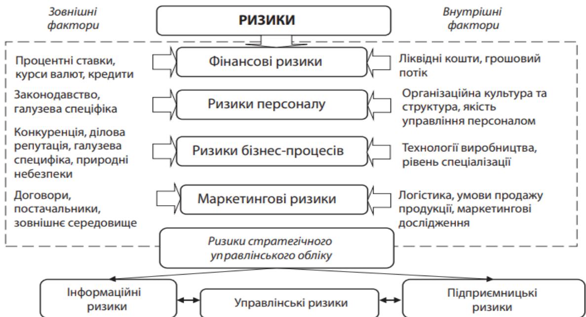
Рис. 1.2. Фактори та причини, які визначають ризики стратегічного управлінського обліку

Стандарт FERMA виокремлює ключові загрози, до котрих віднесено фінансові, стратегічні, операційні ризики та небезпеки. Вважаємо за доцільне в стратегічному управлінському обліку для стратегічного управління з урахуванням ризиків фіксувати їх на основі системи збалансованих показників за принципом розумної достатності (рис. 1.2).