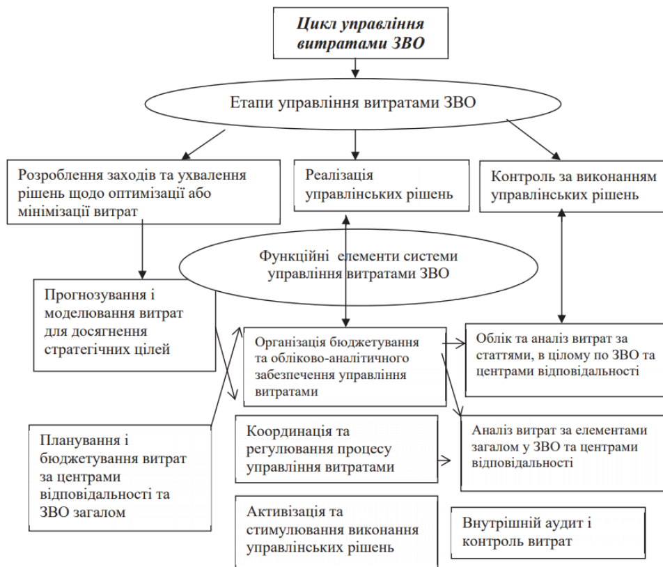
Рис. 3.2. Основні етапи та функціональні елементи системи управління витратами ЗВО

Формування системи управління витратами залежить від специфіки та масштабів діяльності ЗВО, форми власності, організаційної структури. У системі управління витратами вирізняють такі аспекти: організаційний, мотиваційний та функційний [2, с. 28]