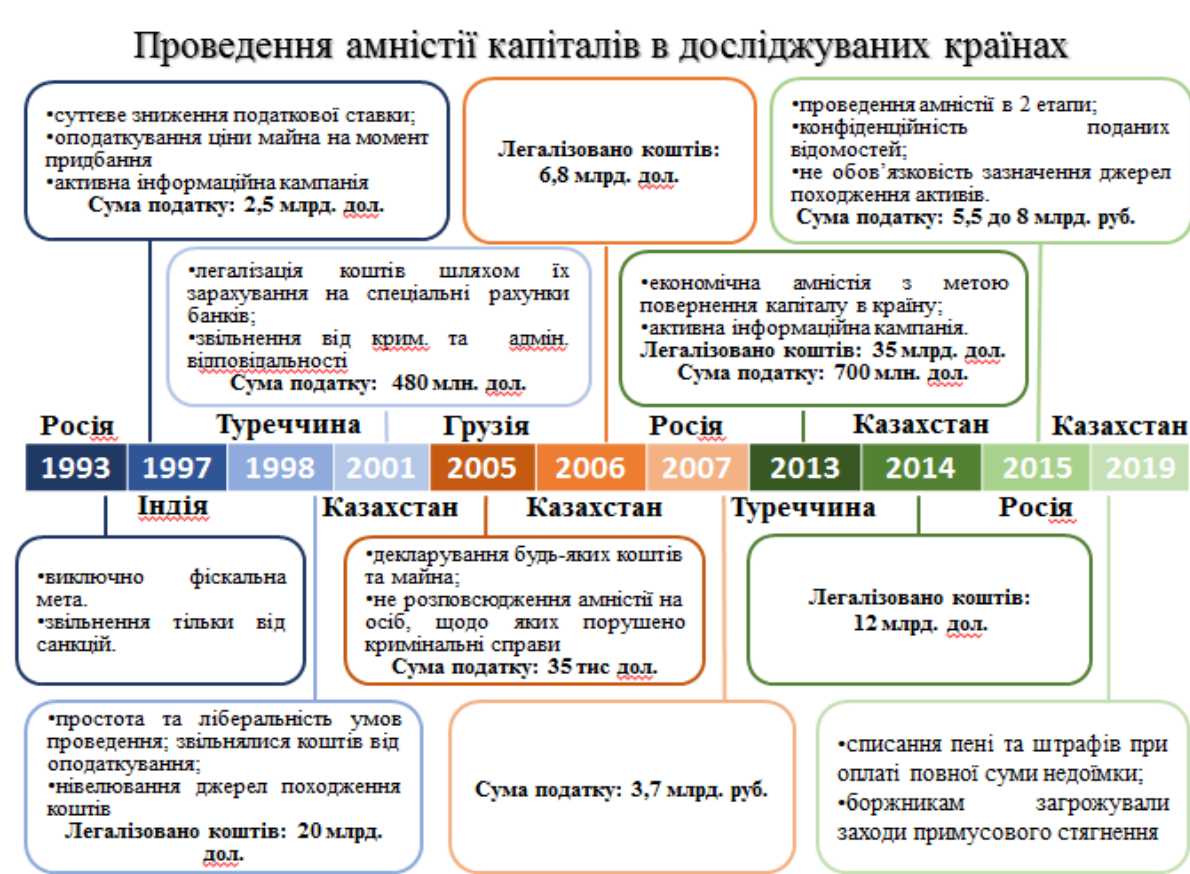
Рисунок 1.2 Наслідки проведення амністії капіталів (добровільного розкриття доходів) в окремих досліджуваних країнах.

інформації, що проводиться шляхом добровільного розкриття доходів, щоб в першу чергу це не стримувало платників податків. Як остаточний крок у процесі прийняття рішень щодо запровадження програм добровільного розкриття доходів, податкові адміністрації повинні удосконалювати власну комунікаційну стратегію. Комунікаційна стратегія повинна містити два основні компоненти: спілкування з цільовим платником податків з метою залучення та заохочення їх до участі у програмах та спілкування із сумлінними платниками податків, щоб створити розуміння програми. На практиці застосування будь-якої схеми реалізації програми добровільного розкриття доходів призводить до стимулювання суб'єктів до дотримання вимог податкового законодавства, а інформація про здійснену легалізація «підживлює» очікування наступної легалізації у інших суб'єктів.