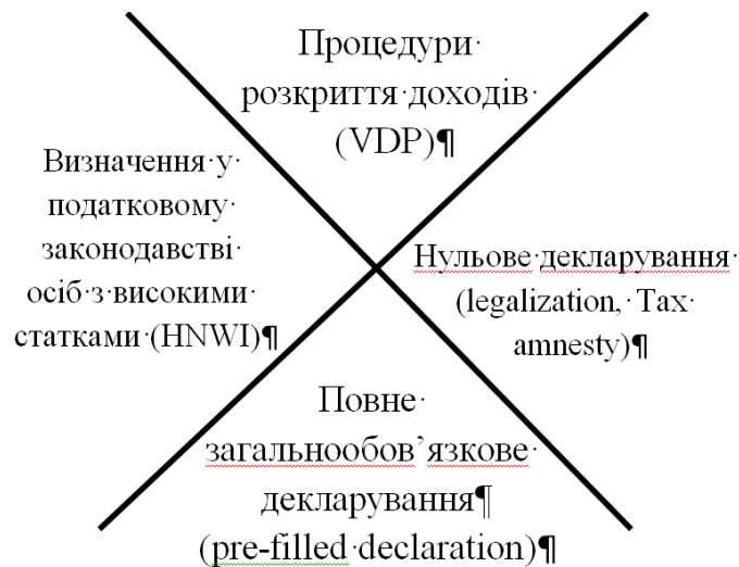
Рисунок 1.1 Механізми стимулювання добровільного розкриття незадекларованих активів

Структури механізму стимулювання добровільного розкриття незадекларованих активів представлено на Рис. 1.1