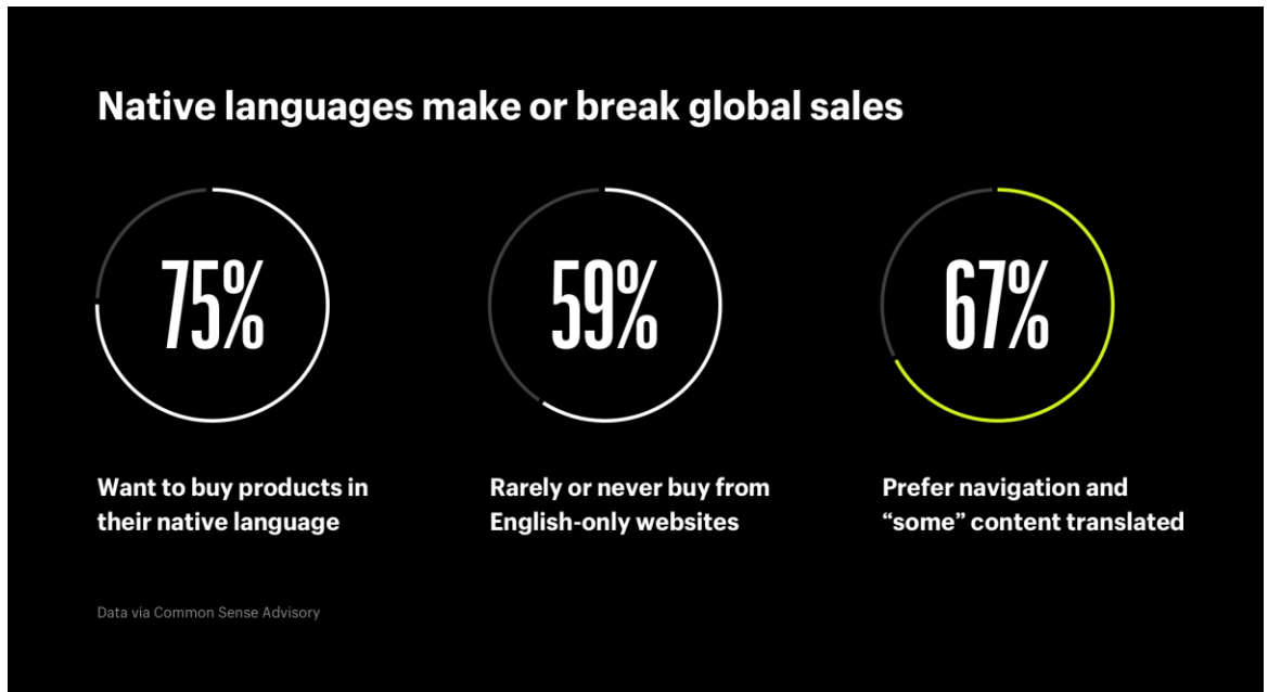
Рисунок 2.2. - Використання рідної мови у глобальній торгівлі Джерело: [76].

Важливим є також використання мови у сфері електронної комерції. Як це не дивно, але більшість користувачів віддають перевагу купівлі товарів в інтернет-просторі на сайтах які використовують рідну мову (таких 75 %). Це демонструє наступний рис. 2.2.