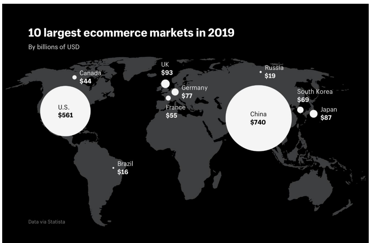
Рисунок 2.1. Десять найбільших інтернет магазинів світу

Інше визначення Internet-магазину характеризує його як реалізоване в мережі Internet представництво шляхом створення Web-сервера для продажу товарів та пов'язаних з ними послуг користувачам Internet. Кількість представлених на сервері видів товарів може коливатися від кількох одиниць до кількох тисяч. Для прикладу наведемо дані про десять найбільших інтернет магазинів світу (рис.2.1).