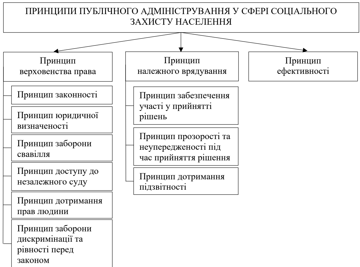
Рис. 2.1. Принципи публічного адміністрування у сфері соціального захисту населення

Враховуючи те, що державне управління здійснюється за загальними та спеціальними принципами організації та діяльності, а конкретизація принципів державного управління опосередковується конкретною сферою суспільних відносин, вважається за необхідне виділяти принципи публічного адміністрування у сфері соціального захисту населення (рис. 2.1).