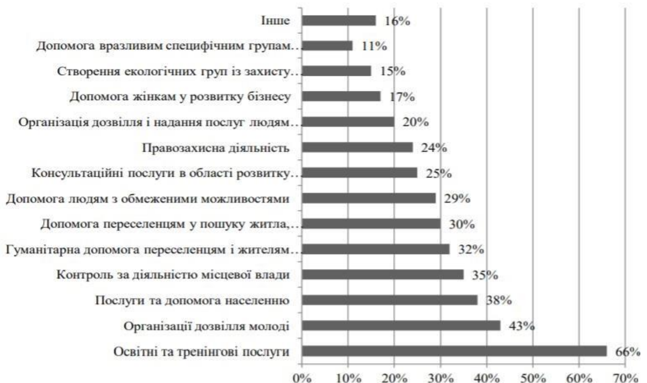
Рис. 2.1. Основні напрямки діяльності громадських об'єднань станом на 2020 р.

Основні напрямки діяльності ГО станом на 2020 р. наведено на рис. 2.1.