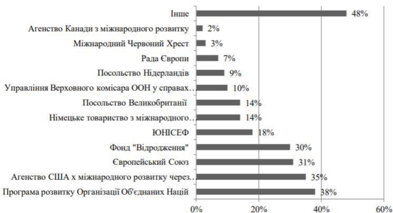
Рис. 2.4. Структура донорських організацій, які надавали гранти громадським об'єднанням

На рис. 2.4 наведено структуру донорських організацій, які надавали гранти ГО.