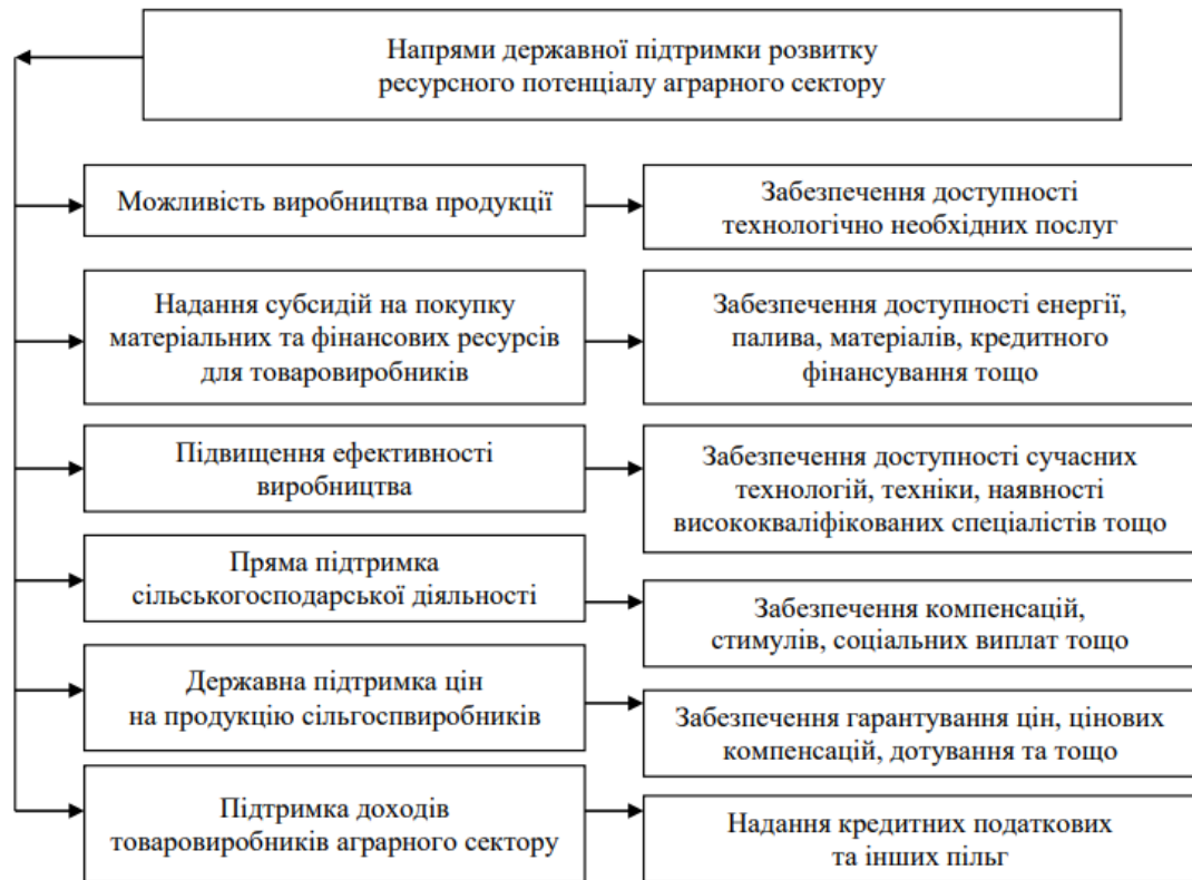
Рис. 3.1. - Основні напрями використання державної підтримки розвитку ресурсного потенціалу аграрного сектору

Система державного регулювання відтворення ресурсного потенціалу аграрного сектору не ізольована від інших систем, а передбачає багато комунікацій із навколишнім середовищем, що становить складне та неоднорідне утворення, що включає: суперсистему (систему вищих навчальних закладів, наказ, що визначає вимоги та обмеження цієї системи); елементи або підсистеми (підпорядковані системи); системи на тому ж рівні, що й дана. Така складна єдність системи з її середовищем називається законом заразності. У нашому випадку мова йде про ієрархічну структуру ресурсного потенціалу аграрного сектора.